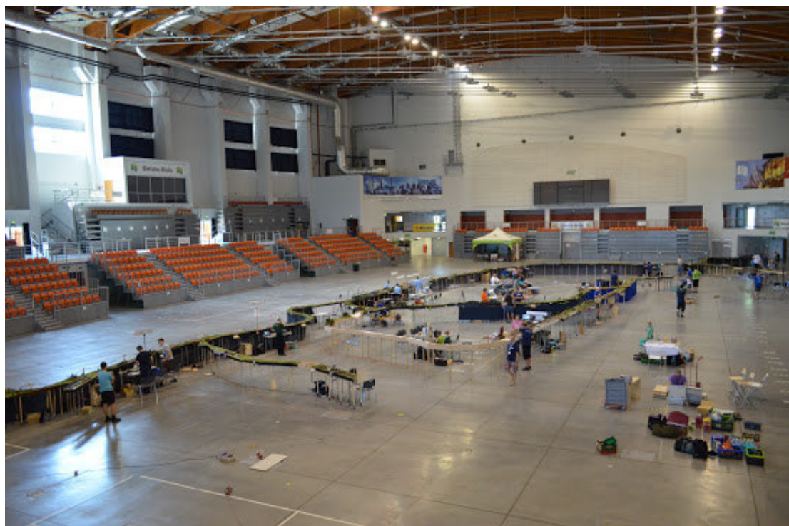
Wnętrze hali / Hall BBOSIR inside.