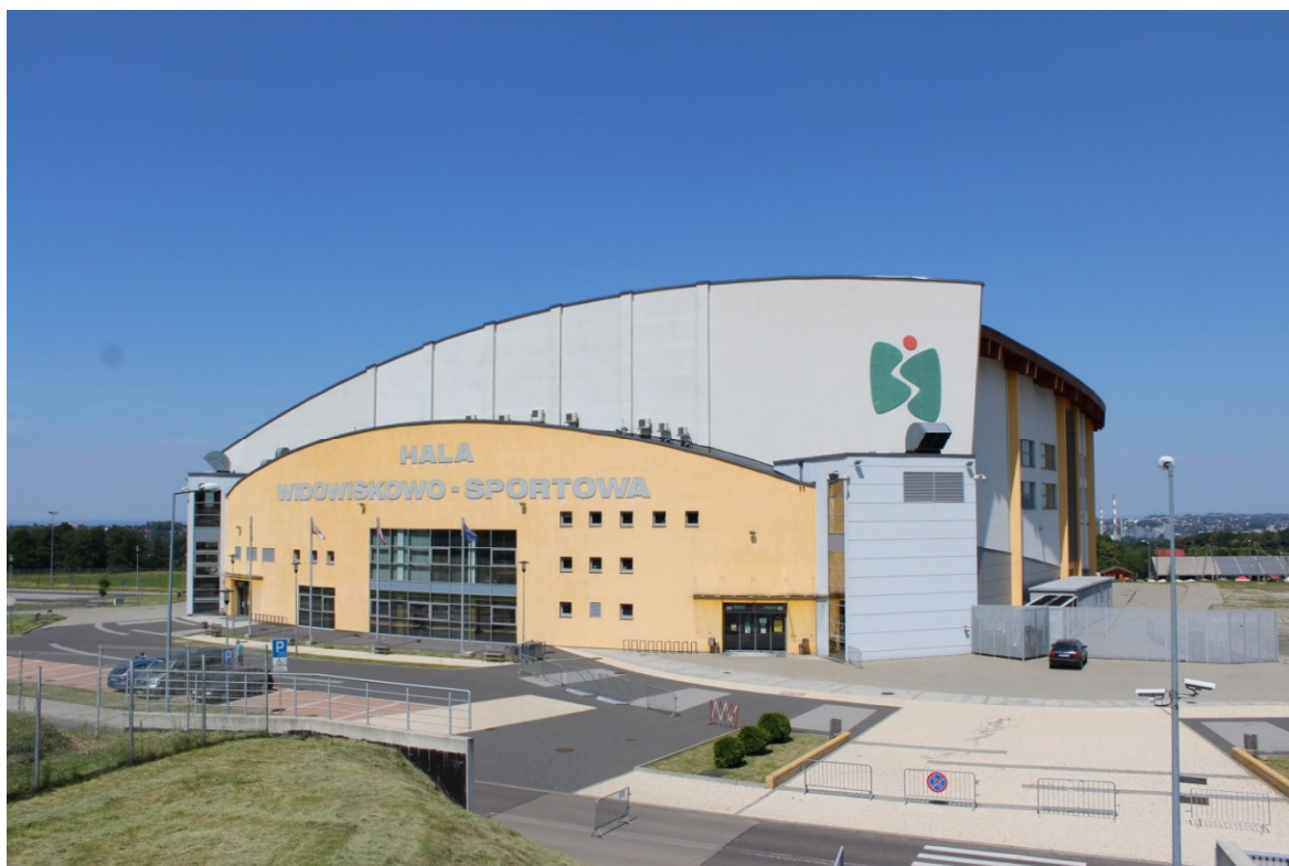
Hala BBOSIR, Hall BBOSIR.