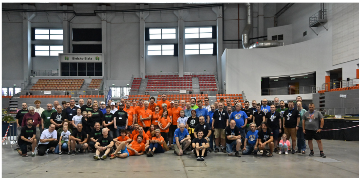
Zdjęcie grupowe 2024 / Group photo 2024